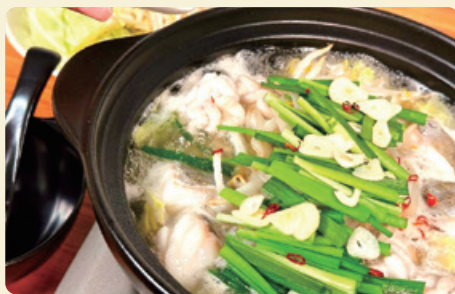
鰯と白子のうま塩鍋